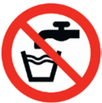
Abbildung 2: Zeichen für „Kein Trinkwasser“

Nichttrinkwasserleitungen sind nach der Trinkwasserverordnung und nach DIN 2403 eindeutig und dauerhaft farblich unterschiedlich zu kennzeichnen, damit es zu keiner Verwechslung kommt. Alle Entnahmestellen der RWNA sind mit einem Schild „Kein Trinkwasser“ oder dem Bild (Abb.2) zu kennzeichnen.